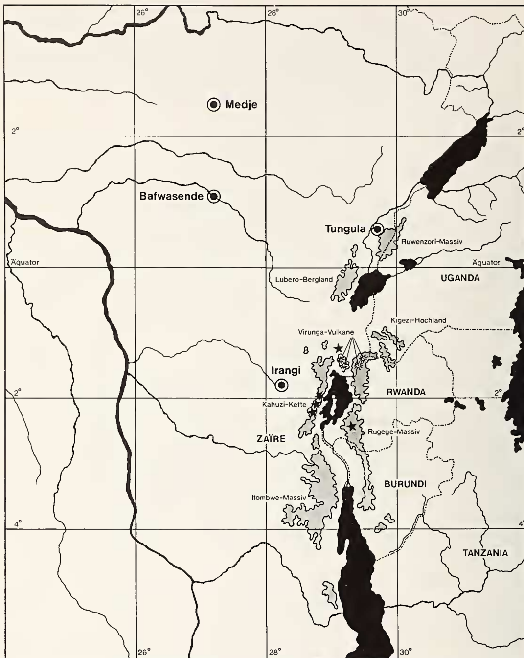
Abb. 1: Die Verbreitung der drei Arten der Untergattung Kivumys ; woosnami : graue Zonen, die gleichzeitig alle oberhalb 2000 m liegenden Gebiete entlang des Grabenbruches bezeichnen; luteogaster : vier Fundorte mit schwarzweißen Kreisen; medicaudatus : Sternchen im Bereich des Kivusees.

Medje und Irangi, während der Fundort Tungula (Nebenfluß des Semliki) die Verbreitung der Art weit nach Osten ausdehnt (Verschuren et al. 1983). Bezeichnenderweise für L. luteogaster liegt dieser Ort trotz der Höhenlage von 1100 m noch im Bereich des äquatorialen Tieflandregenwaldes.